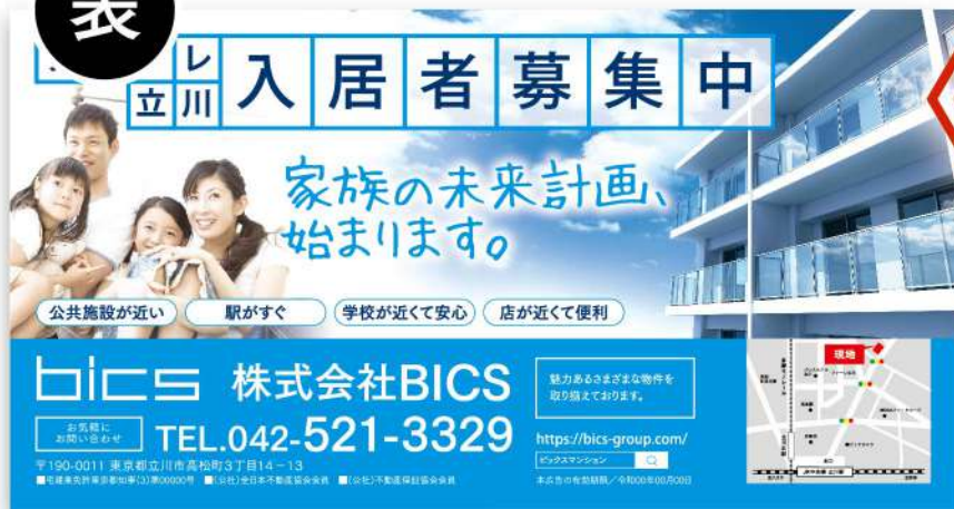
※広告デザインイメージ(例)