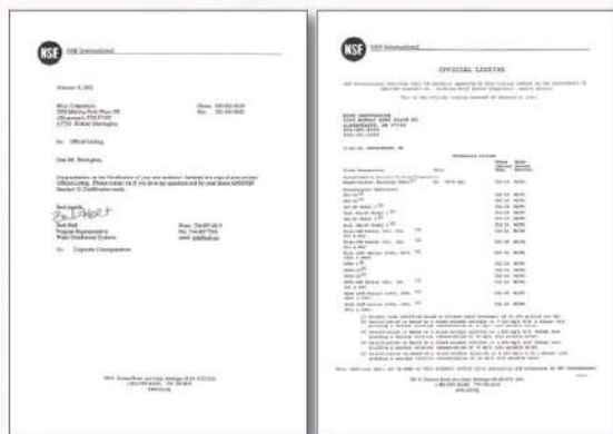
NSF International Official Listing ANSI/NSF Standard 61

NSF International Official Listing ANSI/NSF Standard 61の認定を取得。 国内でも既に多くの導入実績があります。